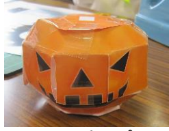
ペーパークラフト