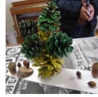
どんぐり松ぼっくり 工作